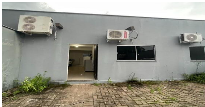
Figura 3: Entrada do imóvel

Já no espaço interno, verificamos que o local onde hoje funciona uma copa, pode ser adaptado, com um divisória para ser destinado a recepção e também para o gabinete do escrivão ou delegado que atender no cartório especializado da mulher.