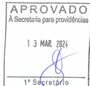
JAIR FARIAS Deputado Estadual

Diante da relevância do assunto, por tratar-se de ação com grande alcance e importância econômica e social, solicito o apoio dos nobres pares para a aprovação do nosso requerimento.