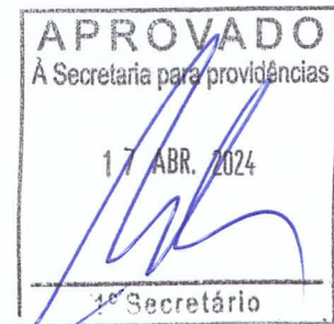
JAIR FARIAS Deputado Estadual

Diante do exposto, solicitamos o apoio dos nobres pares para a aprovação do nosso requerimento, atendendo as reivindicações da população.