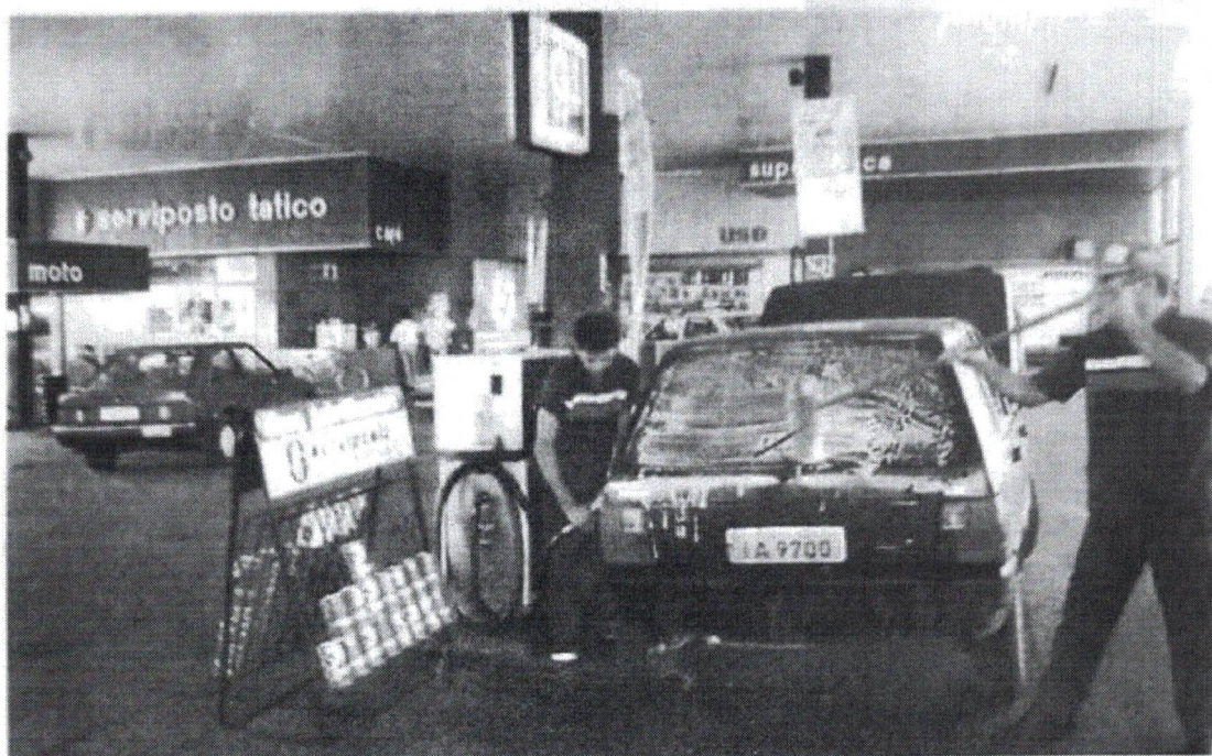
Prestando um serviço de vanguarda, o Posto Tatico é um dos mais bem montados de Araguaína

N ovamente o sucesso foi repetido com moderno equipamento obedecendo o prumo total da empresa que representa, e graças aos amigos e clientes que havia conquistados na oficina. O posto foi planejado para vender em torno de 100.000 litros mês; porém, logo no primeiro ano atingiu o patamar de 300.000 litros.